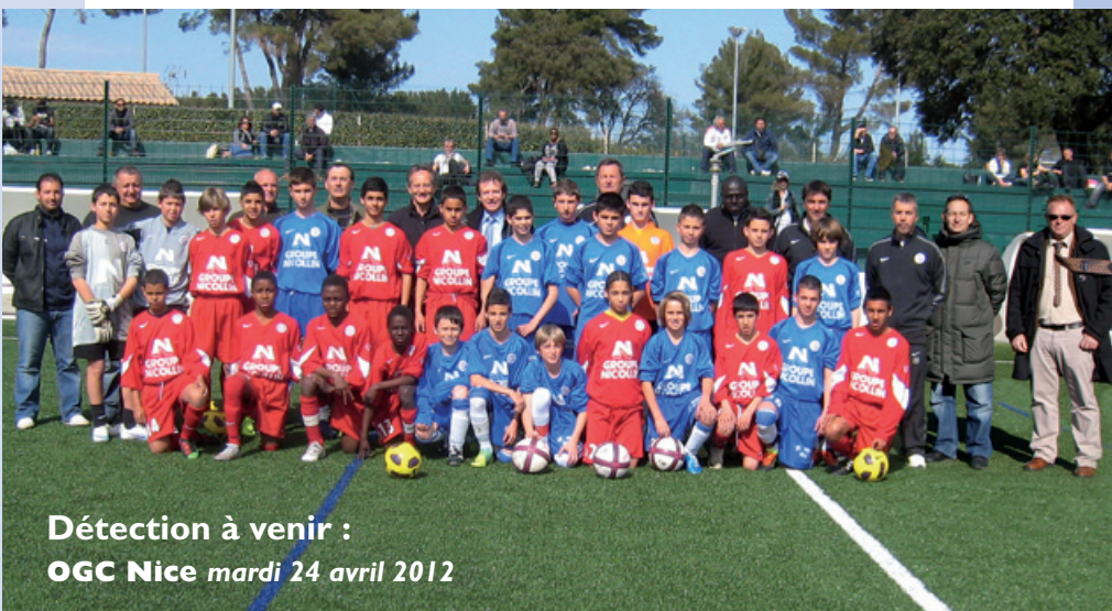
Détection à venir : OGC Nice mardi 24 avril 2012

Reconverti comme dirigeant, d'abord à Caen puis au Paris SG, il devient en 2000 l'entraîneur du Havre AC, qu'il fait monter en première division après deux saisons. En 2004 il rejoint Montpellier HSC en Ligue 2, où il est démis de ses fonctions le 24 avril 2007 et remplacé par Roland Courbis par le président du club, Louis Nicollin, en raison de la place de relégable qu'occupe alors Montpellier. Il reste cependant au sein du club héraultais dont il est actuellement le manager du centre de formation.